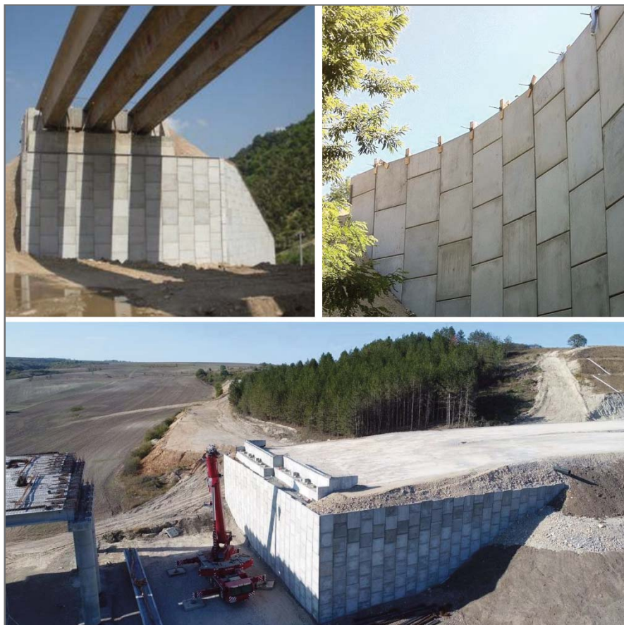
Рис. 4. Примеры подпорных стен, созданных с использованием системы «МакРес»

8) специализированная компьютерная программа Macres позволяет выполнить точный расчет армогрунтовой конструкции и в целом сооружения на основе системы «МакРес» на внутреннюю и общую устойчивость, по-