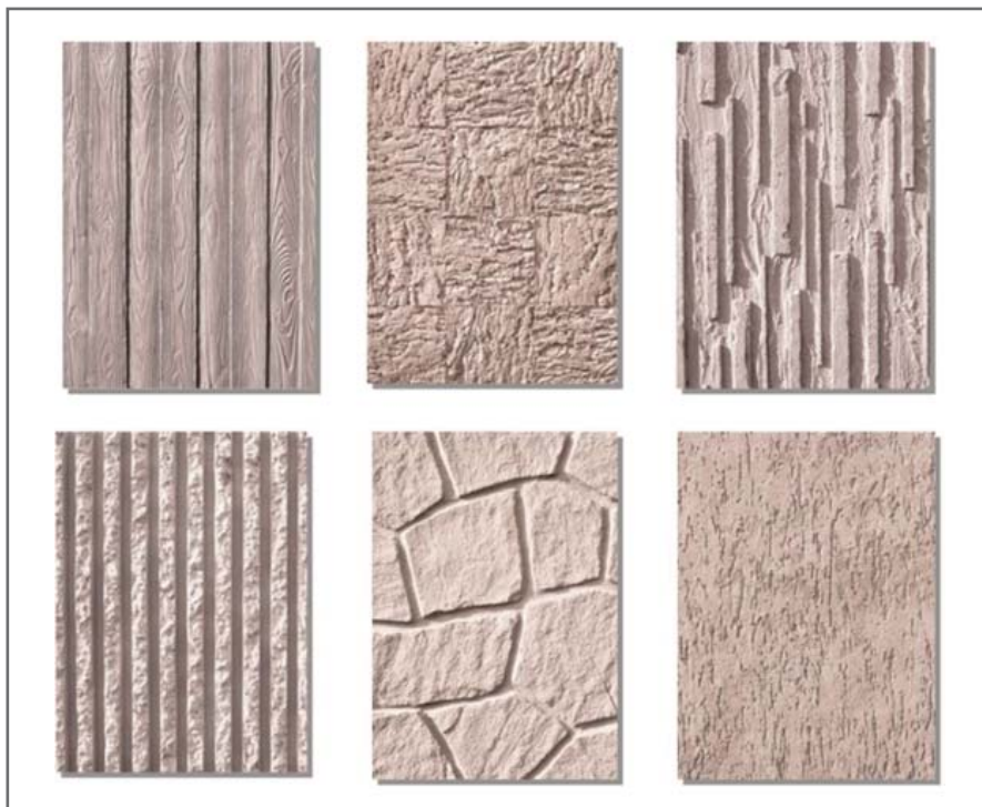
Рис. 5. Виды облицовочных панелей, предлагаемых компанией «Маккаферри» для подпорных стен на основе системы «МакРес»

строить поперечный и продольный разрезы сооружения с указанием расположения и видов облицовочных панелей.