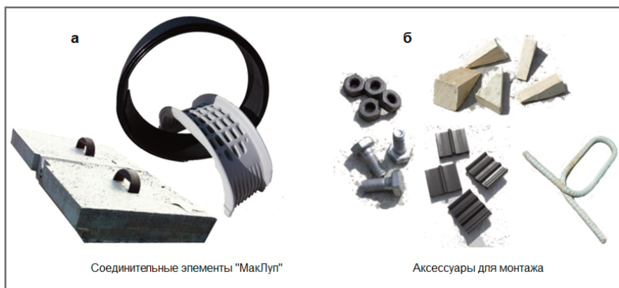
Рис. 3. Соединительные элементы «МакЛуп» (а) и аксессуары для монтажа (б) системы «МакРес»

особенностей того или иного проекта, условий строительства, специфики климата и грунта.