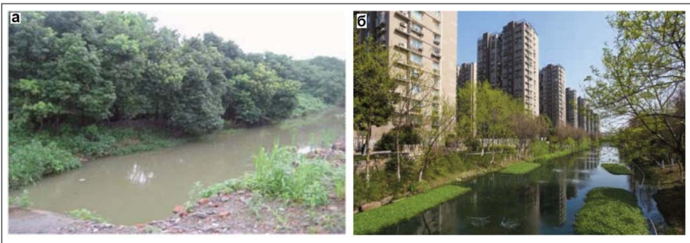
Рис. 2. Фотографии реки Данунган до (а) и после (б) рекультивации этого водотока и создания на его поверхности плавучих островков из растений

среды, подходящей для размножения и роста водных и околоводных растений, животных и микроорганизмов и улучшения способности водных объектов к самоочищению.