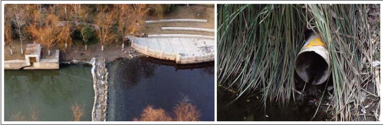
Рис. 1. Фотографии реки Данунган до начала реализации модели экологичного «города-губки»