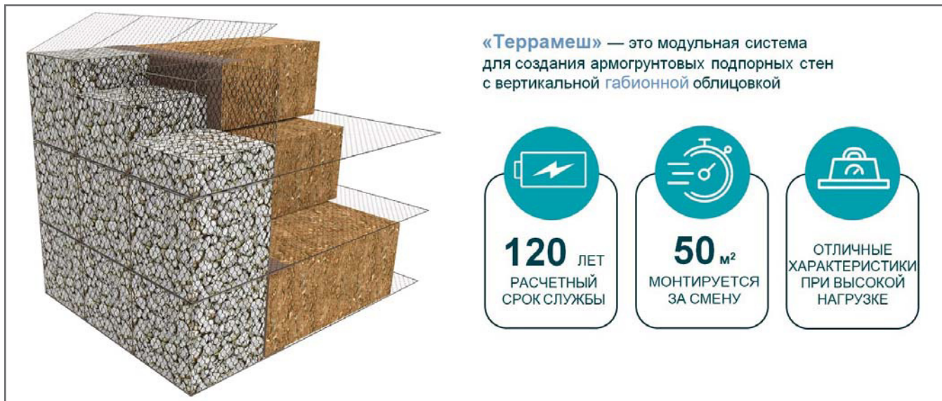
Рис. 1. Схематичное изображение устройства армированного сооружения на основе системы «Террамеш» и преимущества этой системы

тов составляет 120 лет. Этот параметр определяется по формулам из нормативных документов с учетом всех коэффициентов запаса прочности.