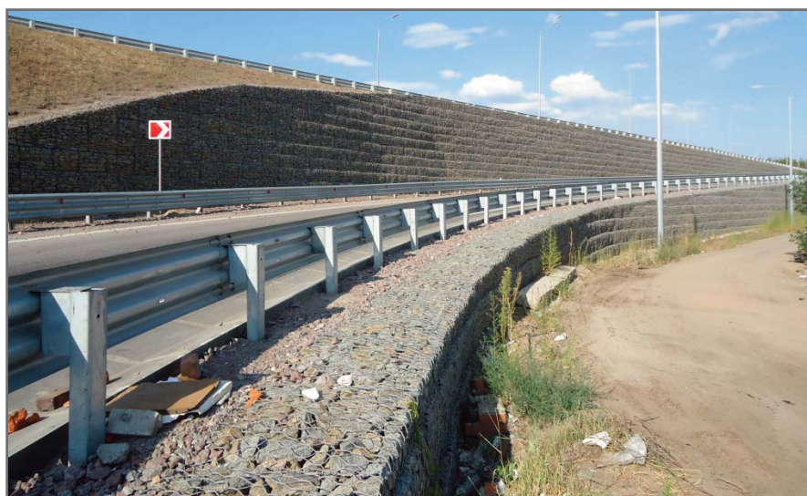
Рис. 2. Армированное сооружение каскадного типа на основе системы «Террамеш» на обходе г. Воронежа на 507 километре трассы М4 «Дон»

На границе тыльной стороны блоков и грунта обратной засыпки укладывают нетканый геотекстиль, чтобы предотвратить проникновение мелких частиц грунта в тела коробчатых габионов, заполненных каменным материалом, и