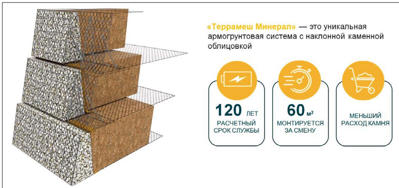
Рис. 5. Схематическое изображение устройства армогрунтового сооружения на основе системы «Террамеш Минерал» и преимущества этой системы

ний, например при слабых грунтах оснований, стесненном пространстве для работ, суровом климате, наличии сейсмоопасности и т. д. Но они в любом случае должны выдерживать проектные нагрузки и быть долговечными, поэтому выбор наиболее эффективной системы для армирования грунта в каждом конкретном случае чрезвычайно важен. Не менее важно выбрать систему, покупка и использование которой для строительства отнимет минимальное количество времени и денег. Этим критериям вполне отвечают три ключевых продукта компании «Маккаферри», о которых шла речь в настоящей статье. И