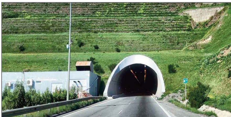
Рис. 4. Армогрунтовое сооружение на основе системы «Зеленый Террамеш» (Грузия)

В своей основе система «Террамеш Минерал» аналогична системе «Зеленый Террамеш». На лицевой стороне армогрунтового сооружения устанавливаются панели из оцинкованной сварной сетки.