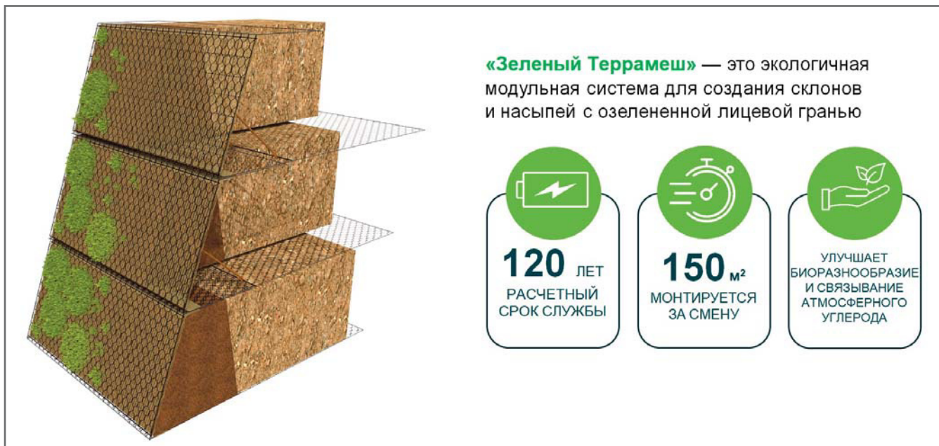
Рис. 3. Схематичное изображение устройства армогрунтового сооружения на основе системы «Зеленый Террамеш» и преимущества этой системы

В качестве яркого примера можно привести использование системы «Зеленый Террамеш» для ликвидации ошибки проектного решения при строительстве одного из дорожных тоннелей в Грузии. При реализации проекта были выполнены вертикальная подрезка горы и искусственное удлинение тоннеля с обеих сторон на 60 м. После завершения строительства подрезанная часть горы стала неустойчивой, а выполаживание склона уже не представлялось возможным. Эту проблему удалось решить с помощью устройства армогрунтового сооружения на основе системы «Зеленый Террамеш», которое обеспечило устойчивость сползающего склона и гармонично вписалось в существующий ландшафт после его озеленения (рис. 4).