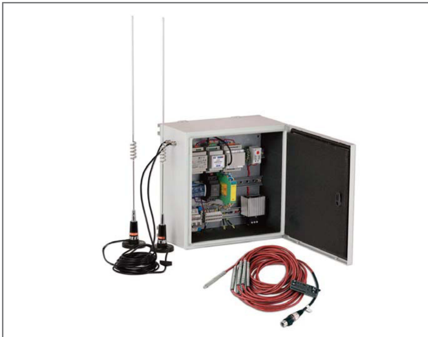
Рис. 1. Шкаф сбора и передачи данных (ШСПД) и термокоса МЦДТ 0922