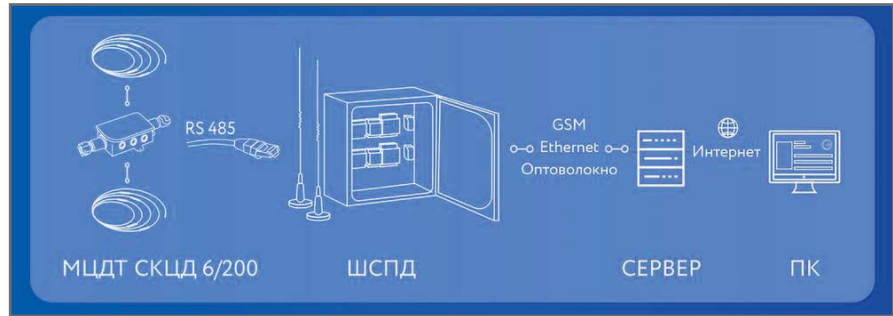
Рис. 10. Автоматизированный мониторинг температуры при помощи стационарного контроллера СКЦД

Этот вариант отличается от предыдущего (классического) тем, что между