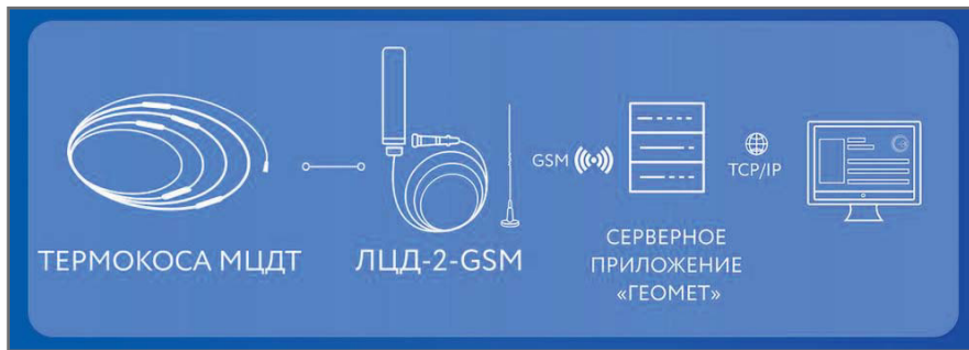
Рис. 7. Автоматизированный мониторинг температуры при помощи логгера ЛЦД-2-GSM