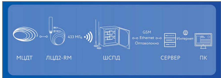
Рис. 11. Автоматизированный мониторинг температуры при помощи логгера ЛЦД2-RM

обсадной трубой и самой термометрической скважиной есть наличие теплоизоляции, позволяющей более достоверно измерять температуру в скважине на малой глубине (от 0 до 3 м) из-за того, что колебания температуры окружающей среды оказывают меньшее влияние на малых глубинах.