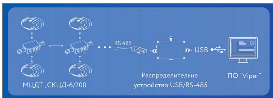
Рис. 9. Стационарный вариант мониторинга температуры с проводной передачей данных при помощи контроллеров СКЦД-6/200

диоканалу непосредственно на ноутбук или ПКЦД-2 с последующей передачей на ПК через USB (рис. 5). ЛЦД-2-RM обеспечивает передачу данных по радиоканалу 433 МГц на расстояние до 1 км.