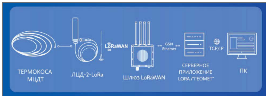
Рис. 8. Автоматизированный мониторинг температуры при помощи логгера ЛЦД-2-LoRa