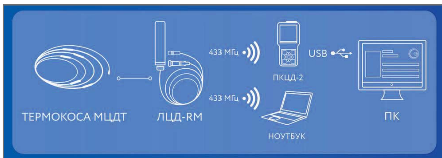
Рис. 5. Мониторинг температуры в ручном режиме при помощи логгера с радиоканалом ЛЦД-2-RM