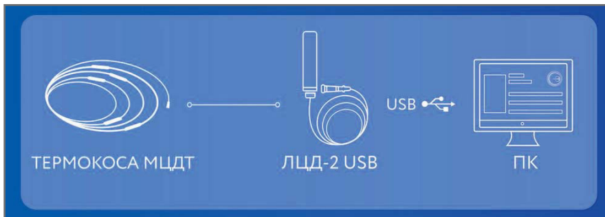
Рис. 4. Мониторинг температуры в ручном режиме при помощи логгера с USB-выходом