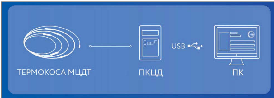
Рис. 3. Мониторинг температуры в ручном режиме при помощи переносного прибора ПКЦД